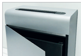
Réceptacle avec système de compactage des particules