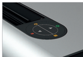
Interrupteur multi-fonctions EASY-SWITCH