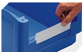
Protèges-étiquette pour bacs à bec, série SK l 178 x l 42 mm 2-1066