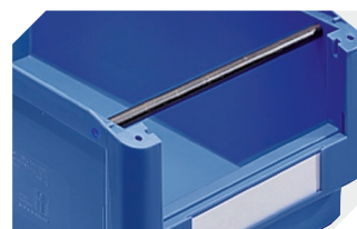
Barres de manutention pour bacs à bec, série SK l 281 mm 2-19527