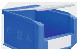
Couvercles anti-poussière pour bacs à bec, série SK l 482 x l 299 x H 2.5 mm 2-1136