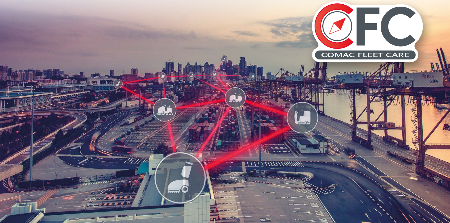
LES TECHNOLOGIES DE VISPA XL