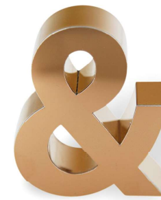
OR ROSE MIROIR