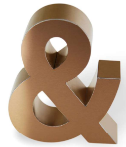
OR ROSE BROSSÉ