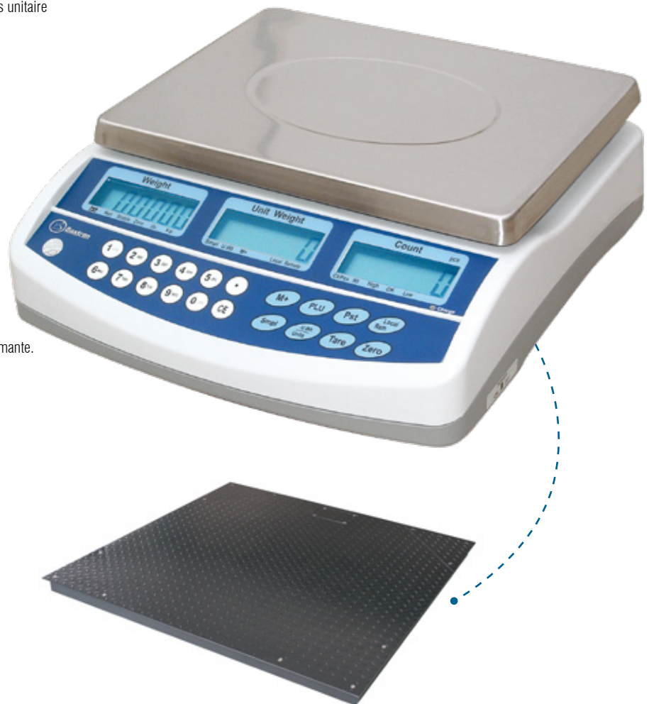
Connectable à plate-forme auxiliaire