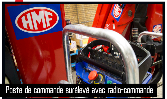
Poste de commande surélevé avec radio-commande

HMF ne transige pas sur le traitement de surface. Cela est possible grâce au traitement ZetaCoat HMF suivi par la pulvérisation de peinture poudre EQC assurant la résistance à la corrosion. Nous vous garantissons la meilleure qualité de peinture imaginable - une qualité qui ne s'altère pas et qui résiste à la corrosion.