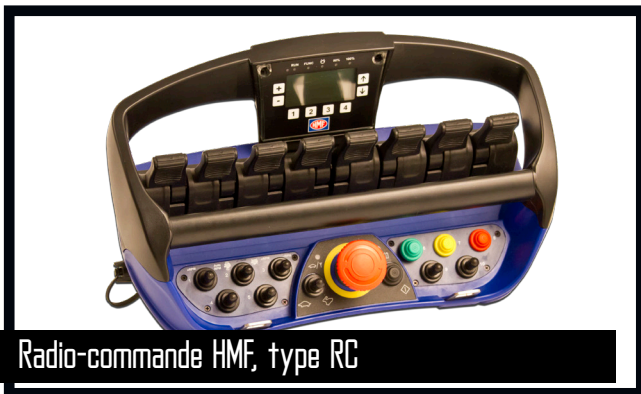
Radio-commande HMF, type RC