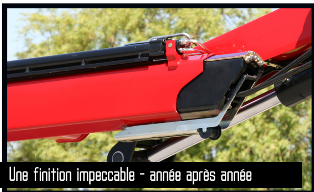
Une finition impeccable - année après année

Le système de contrôle de la stabilité EVS (Electronic Vehicle Stability), dont brevet est déposé, prend en compte la charge restante sur le véhicule pour garantir un équilibre parfait de la grue et du camion. Comme le système prend en compte la charge sur le plateau du camion, celle-ci intervient dans le poids propre du véhicule, vous obtenez alors une zone de travail bien plus grande - grâce à l'EVS.