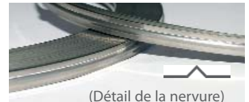
(Détail de la nervure)

Ruban nervuré pour thermosoudage et utilisation à hautes températures.