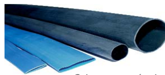
Gains avant rétreint