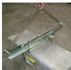
Réf. 9778 (cf page 17)