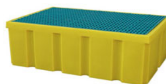
Option : BAC3596ACPE Bac 200 litres