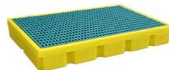
Option : BAC1496ACPE Bac 100 litres