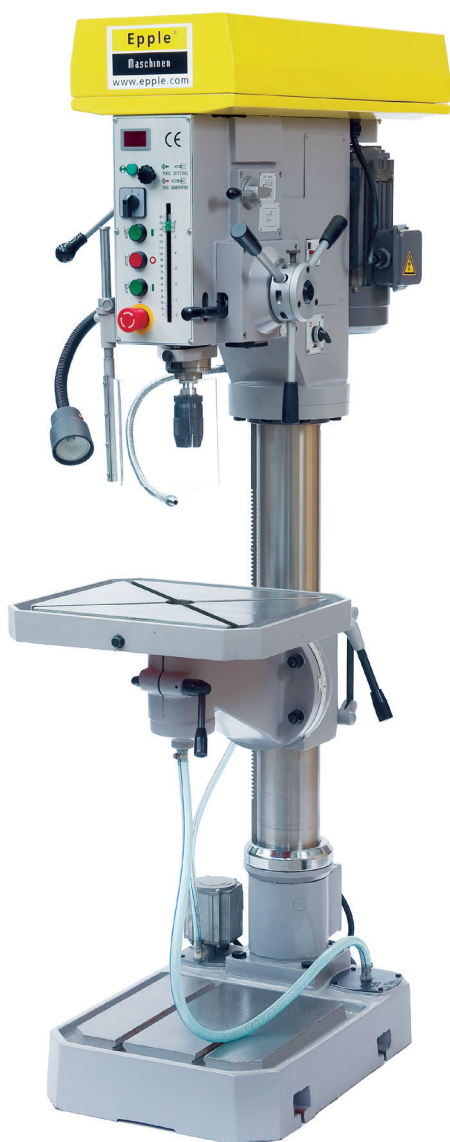
FIG.: SB 55 SV