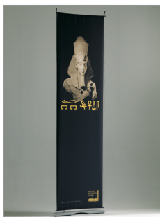
Extension hauteur 800 x 3000