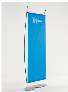
Kakémono 800 x 2000