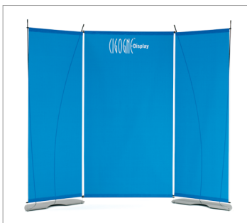
Triptyque 2800 x 2200