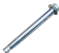
Fixations Béton M10 x 120mm