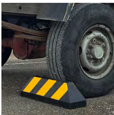
Modèle idéal pour les camions.