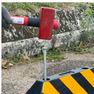
Fixations Enrobé Ø12 x 300mm