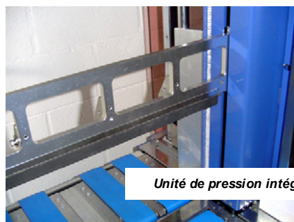
Unité de pression intégrée