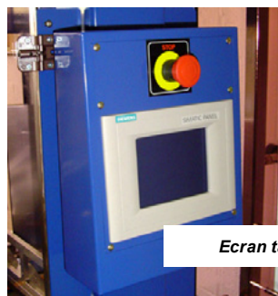
Ecran tactile convivial