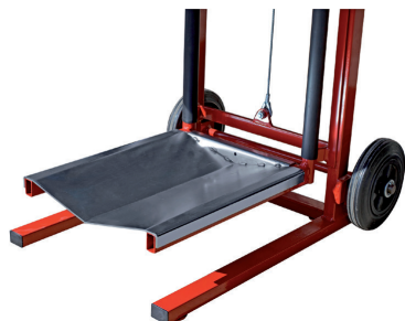
Plateau porte bobine