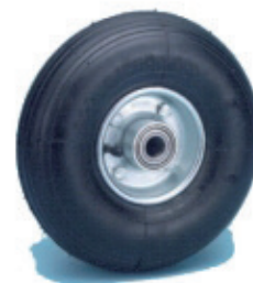
Kit roue gonflable ø200