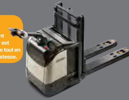
Plate-forme fixe à accès arrière Dans les zones congestionnées et sur de longues distances, la version à accès arrière procure un compartiment sûr et confortable pour le cariste.

Plate-forme fixe à accès latéral Dossier d'appui sur le modèle à accès latéral pour plus de protection et de confort, très adapté au transport et à la préparation de commandes.