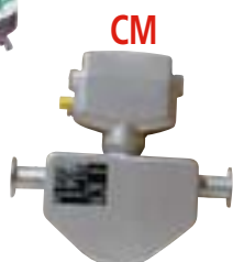
CM Compteur massique