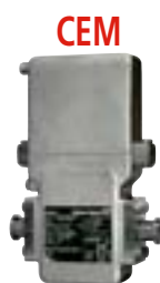
CEM Compteur électromagnétique

Tables réalisées en structure tube Inox-304 brossé ou recouvert époxy. Elles permettent le conditionnement de récipients divers, de 50 millilitres à 10 litres et plus. Pour les grands dosages, un enfûteur à distance peut être rajouté.