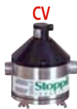
CV Compteur volumétrique à piston rotatif