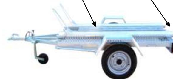
REMORQUE A MOTO 5PM20