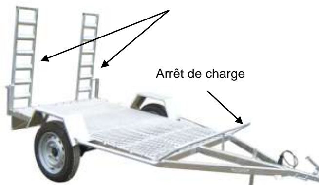
REMORQUE A QUAD 5RQ20 (1 essieu)