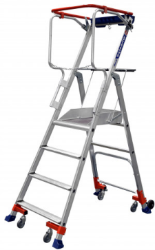
Plate-forme mobile Wheelys 3 et 4 marches - Duarib

Plateforme mobile pour mise en rayon à 4 roulettes