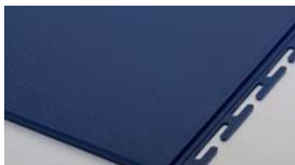
6 mm Texture lisse 'martelé'