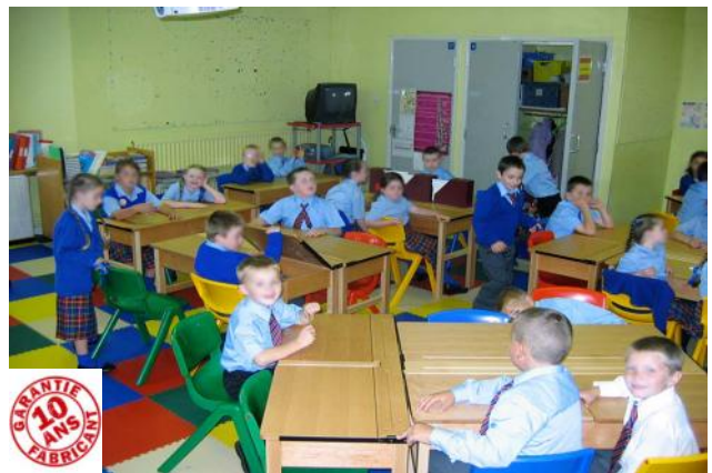
Gain phonique et thermique significatif