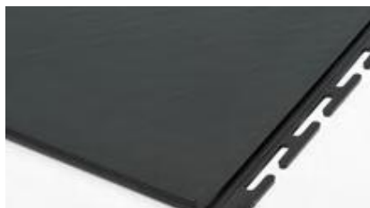
6 mm Texture 'ardoise'