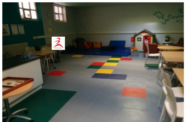
Esthétique ludique .