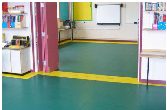
Pose par zone possible !