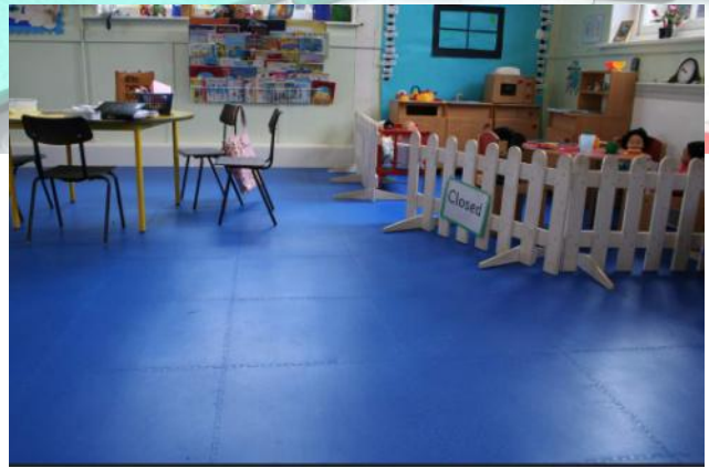
Sans colle , sans odeurs. Idéal petite enfance !