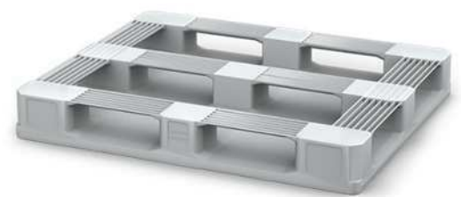
Version 5 semelles