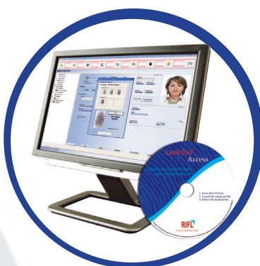
Logiciel LockToo Access Manager