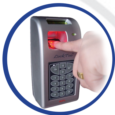
Lecteur biométrique / RFID