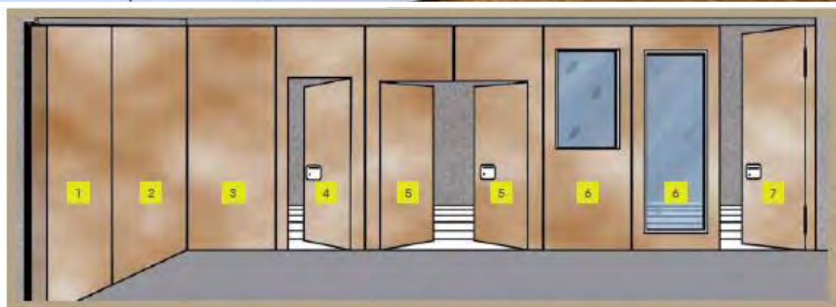
1 Panneau télescopique 3 Panneau simple d'angle 5 Porte de passage à deux vantaux 7 Porte pivot 2 Panneau simple 4 Porte de passage à un vantail 6 Panneaux vitrés