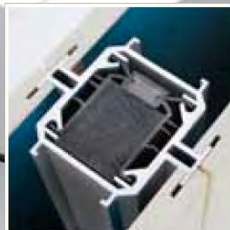
Jonction des panneaux Profil Aluminium invisible