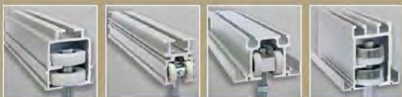
Rail Multidirectionnel MODÈLE 36 jusqu'à 450 kg par panneau Rail Monodirectionnel MODÈLE 38 jusqu'à 180 kg par panneau Rail Monodirectionnel MODÈLE 40 jusqu'à 400 kg par panneau Rail Multidirectionnel MODÈLE 57 jusqu'à 680 kg par panneau

Des galets à base de Teflon assurent une résistance à l'usure et un déplacement silencieux des panneaux (testés sur une distance supérieure à 160 km). En cas de maniement quotidien répété, ceci correspond à une durée de vie de plus de 30 ans.