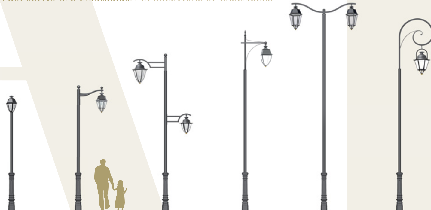
AESON 350 MOUGINS 640