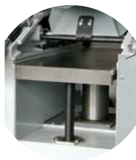
Table de rabotage montée sur 2 fûts Vandiktebanktafel geplaatst op 2 steunstukken