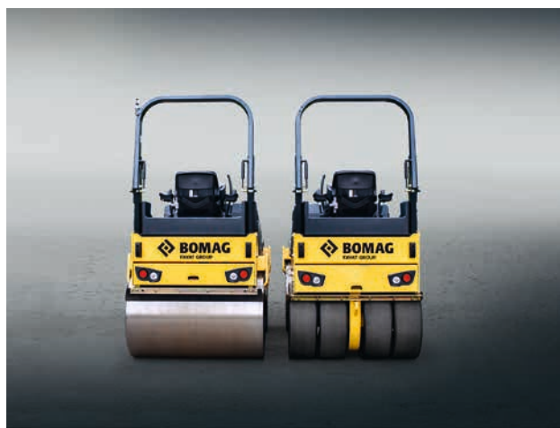
BW135/138 : les poids lourds de 3,9 à 4,3 t.