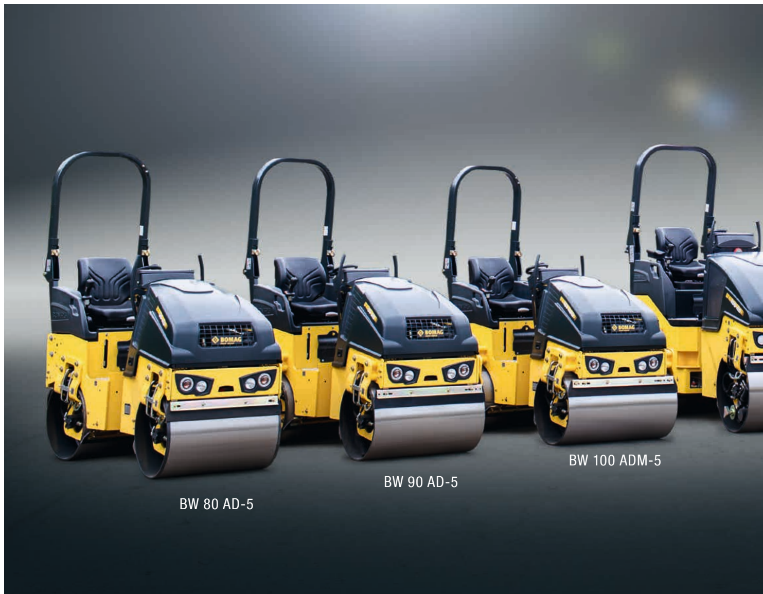
BW 80 AD-5