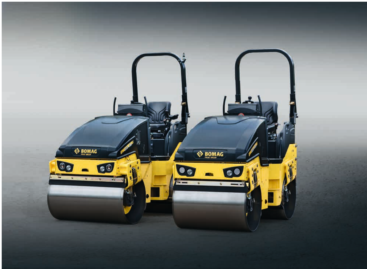
BW100/120 : les universels de 2,3 à 2,7 t.

BOMAG vous propose la machine idéale pour chaque usage. Choisissez parmi les 14 modèles le rouleau et l'équipement qui vous correspond le mieux, à vos usages et votre entreprise.