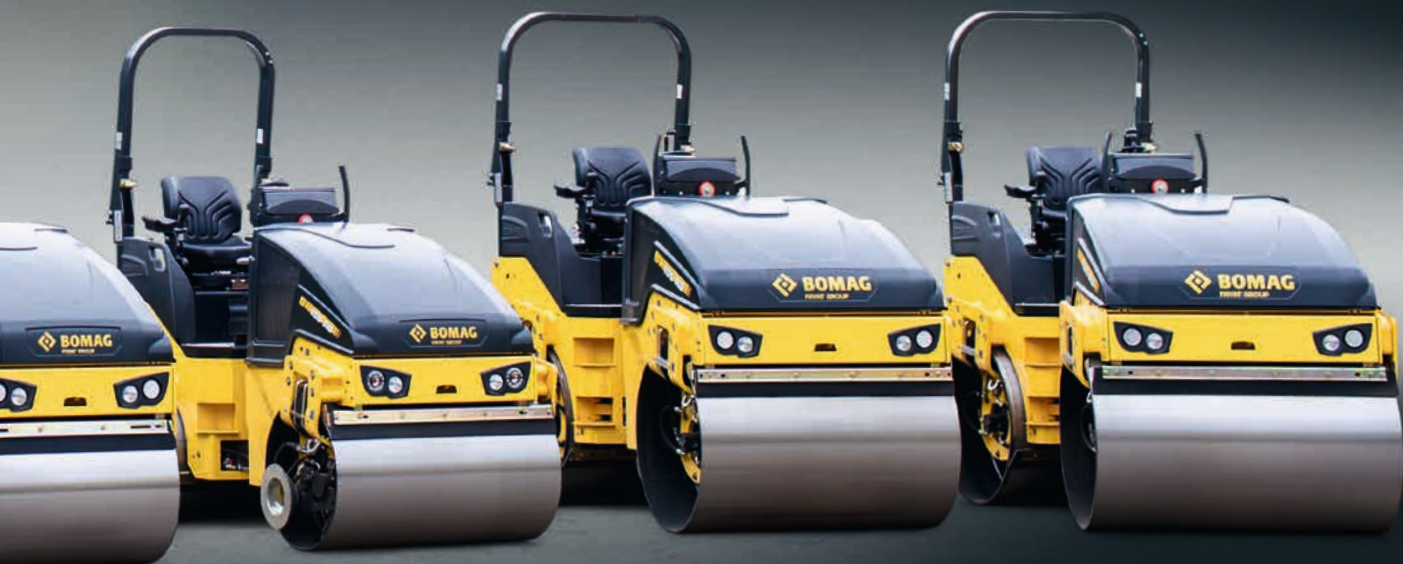
BW 100 AD-5