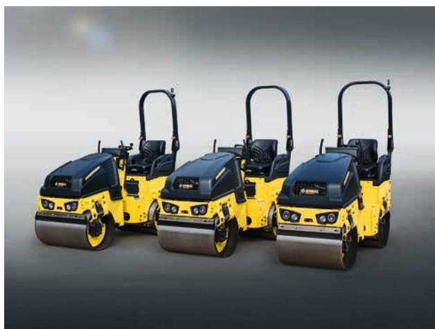
BW80/90/100 : les poids plumes jusqu'à 1,8 t.