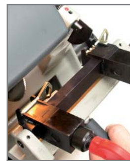
Taillage clés spéciales

Duo Plus est légère, compacte et facilement transportable.