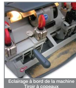
Eclairage à bord de la machine Tiroir à copeaux