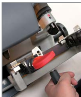
Taillage clés à double panneton

Les étaux 4 faces permettent de tailler une vaste gamme de clés plates. Les étaux pivotants pour les clés à panneton et double panneton sont bi/trifaces et dotés d'un système de prise des clés spéciales du type Abus® et Abloy®.