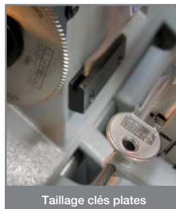
Taillage clés plates