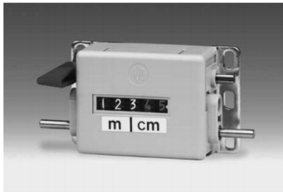
M 310.A - Compteur mètreur «Poids & Mesures»