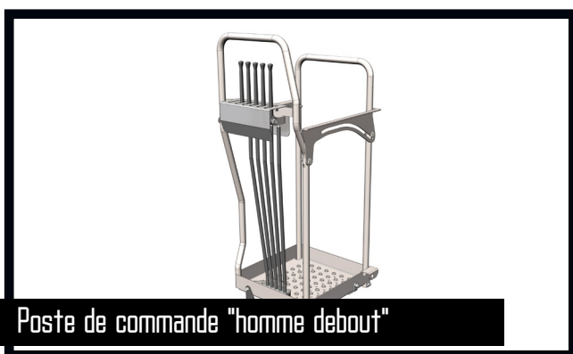
Poste de commande "homme debout"

Avec un poste de commande "homme debout", l'opérateur de la grue a une visibilité particulièrement bonne des mouvements qu'il entreprend avec la grue. En particulier en cas de chargement et de déchargement du camion à l'aide de p.ex. une benne preneuse ou une fourche lève-palettes, l'opérateur de la grue a une visibilité totale tant sur la plate-forme du camion que sur la zone de travail. L'opérateur de la grue est protégé par le système de sécurité HSL ou HSL-E qui empêche que la grue ne heurte l'opérateur sur la plate-forme.