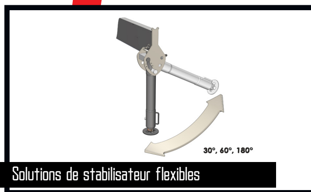
Solutions de stabilisateur flexibles

Avec un poste de commande "homme debout", l'opérateur de la grue a une visibilité particulièrement bonne des mouvements qu'il entreprend avec la grue. En particulier en cas de chargement et de déchargement du camion à l'aide de p.ex. une benne preneuse ou une fourche lève-palettes, l'opérateur de la grue a une visibilité totale tant sur la plate-forme du camion que sur la zone de travail. L'opérateur de la grue est protégé par le système de sécurité HSL ou HSL-E qui empêche que la grue ne heurte l'opérateur sur la plate-forme.