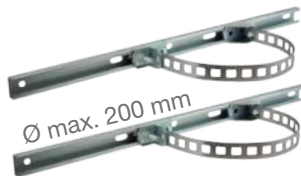
Kit de fixation sur poteau Ø max. 200 mm