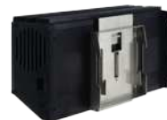
3 Kit de fixation rail DIN pour module 14M DRB9590 (1)