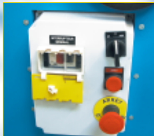
Tableau de commandes

L'interrupteur général condamnable à clef permet de sécuriser la machine lorsqu'elle n'est pas utilisée.