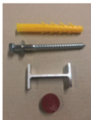
Pièces de liaison et fixations incluses