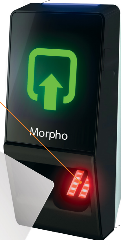
MA SIGMA Lite Avec indicateur lumineux LED bleu/vert/rouge et buzzer