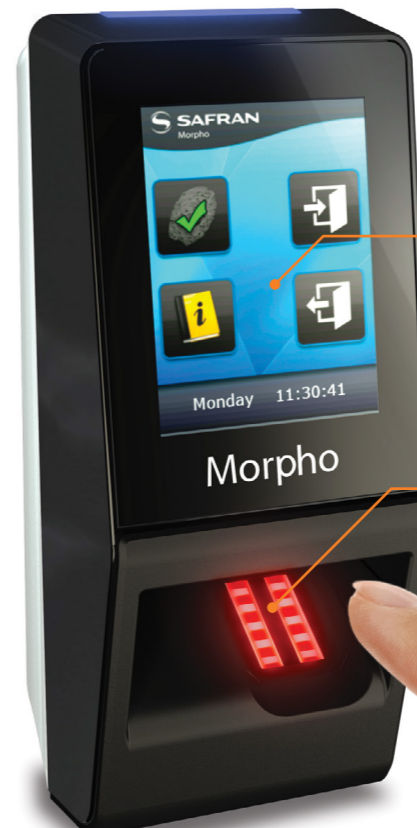
MA SIGMA Lite+ Avec écran couleur tactile QVGA 2.8" et buzzer