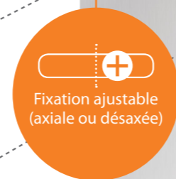
Fixation ajustable (axiale ou désaxée)