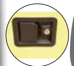
POIGNÉE DE PORTE INTÉGRÉE