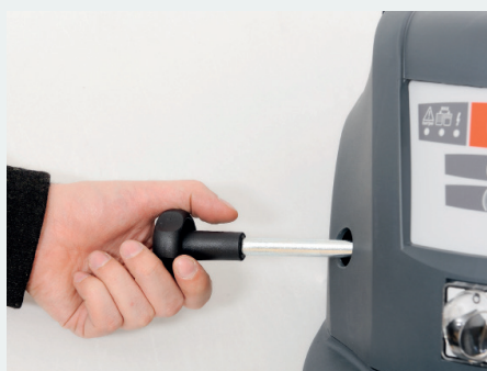
Secouage manuel du filtre