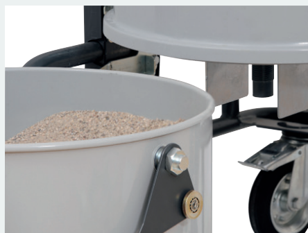
Système d'arrêt "automatique" des solides