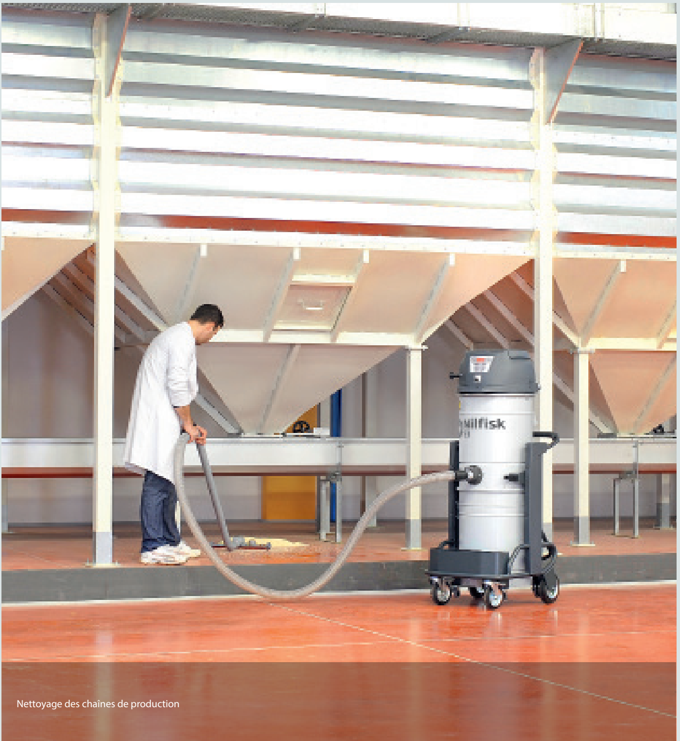
Nettoyage des chaînes de production