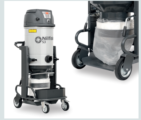
S3 avec système de déchargement par gravité Longopac®