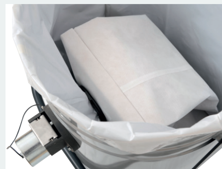
Système de sac sécurisé pour poussières dangereuses