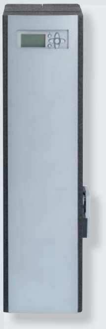
Vitotrans 353 (type PBS)