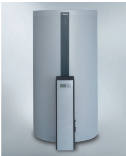
Vitocell 100-E avec Vitotrans 353 (type PZS)

Les modules de production d'eau chaude sanitaire Vitotrans 353 sont prévus pour fonctionner avec une installation solaire. Le bon dimensionnement de l'échangeur du Vitotrans 353 permet de réduire la température des retours et donc d'augmenter l'efficacité du circuit solaire.