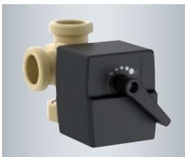
Vanne directionnelle de retour