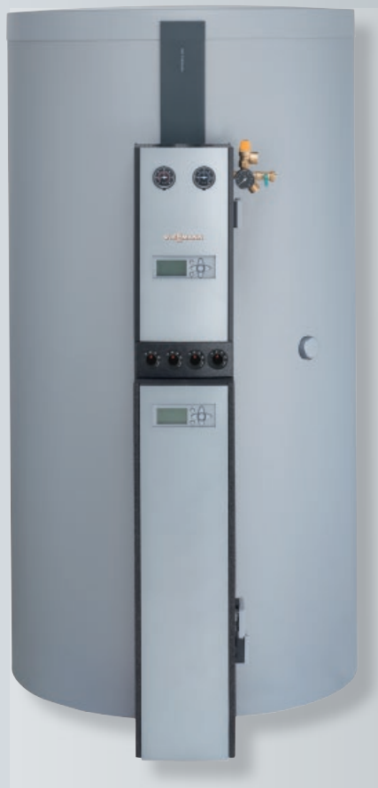
Vitocell 140-E/160-E avec Vitotrans 353 (type PZS) et Divicon solaire (type PS10)