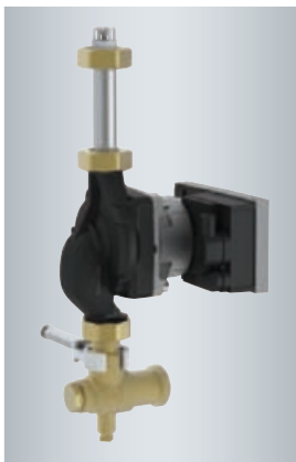
Pompe de bouclage ECS