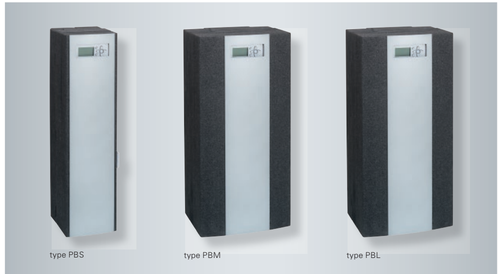
Vitotrans 353, type PBx, pour montage mural