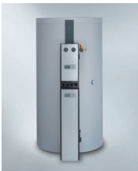
Vitocell 140-E/160-E avec Vitotrans 353 (type PZS) et Divicon solaire (type PS10)