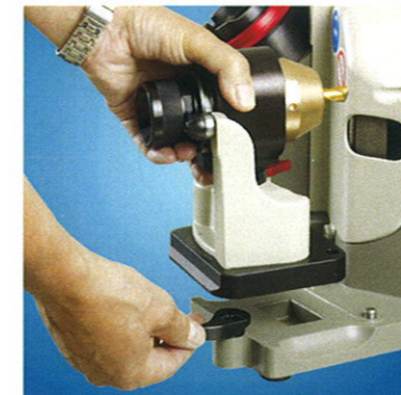
Système de changement rapide des options

L'affûtage en toute simplicité Insérer le mandrin dans le dispositif d'affûtage et tourner comme pour tailler un crayon (env. 10 sec.).