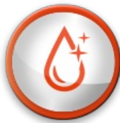
Nettoyage à l'eau