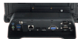
Station de bureau