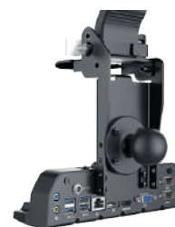
Station d'accueil mobile