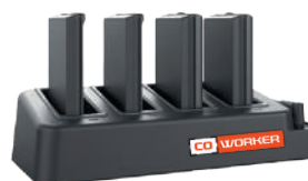
Chargeur de batteries