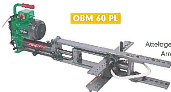
OBM 60 PL