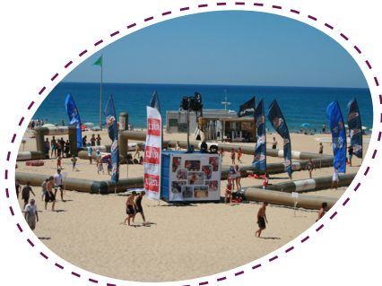
+ TOURNÉE DES PLAGES +