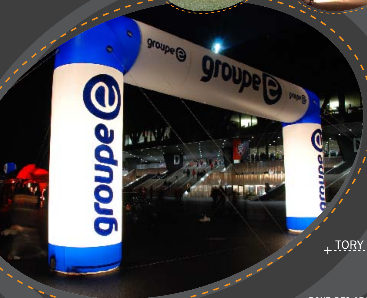
+ TORY +

POUR DES ARCHES SUR MESURE (FORMES SPÉCIFIQUES, DIMENSIONS PRÉCISES), NOUS CONSULTER.