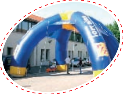
+ DÔME +