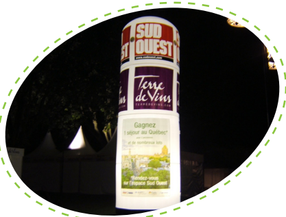
+ COLONNE GÉANTE +