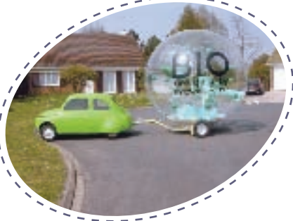
+ SPHÈRE +