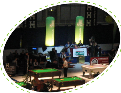
+ COLONNE INDOOR +