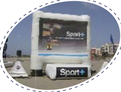
+ TRIPODE SUR PIED +