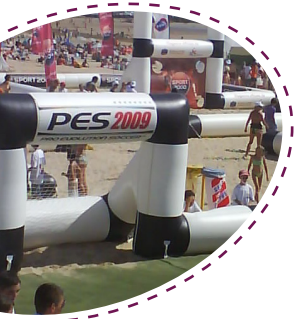
+ BUT DE FOOT +