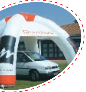
+ BIG IGLOO +