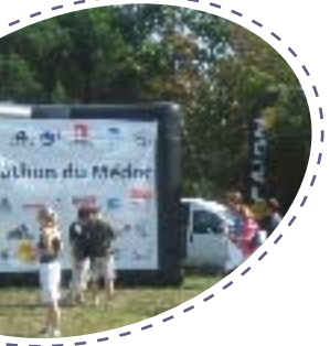
+ ÉCRAN +