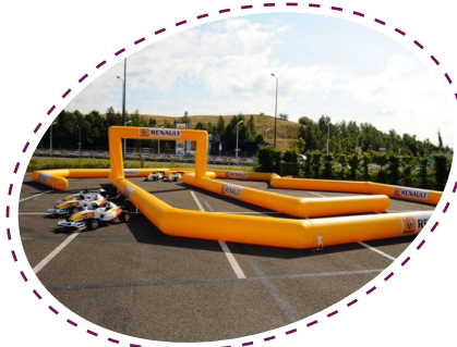
+ CIRCUIT +