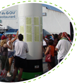
+ PORTE FLYERS +