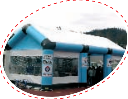
+ BARNUM +