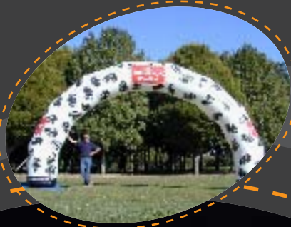
+ ARC +