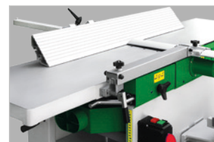
Table de dégauchissage