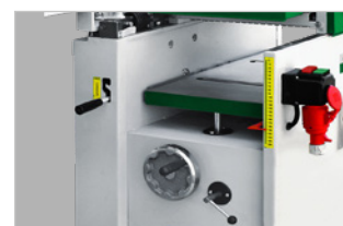
Table de rabotage