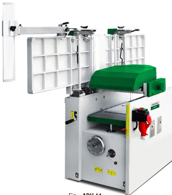
Fig. : ADH 41