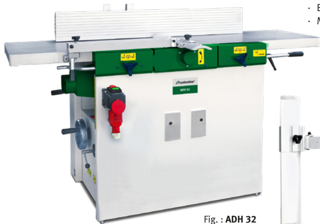
Fig. : ADH 32