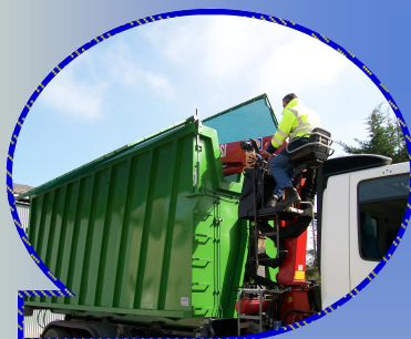
Ouverture des cadres