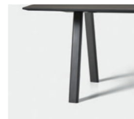
– Aluminum tube (colours M1, M2) Tubo de aluminio (colores M1, M2)