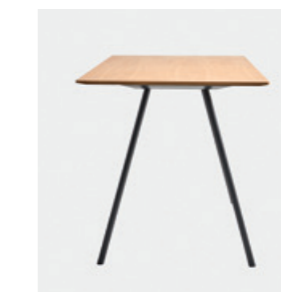
– H.104cm A.104cm