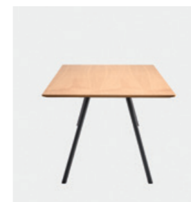
– H.75cm A.75cm