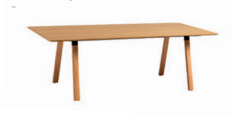
Rectangular tables Mesas rectangulares

1 Section / Sección 90x180cm / 90x200cm / 90x240cm / 90x280cm / 90x320cm / 120x200cm / 120x240cm / 120x280cm / 120x320cm