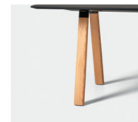
– Solid oak (natural or stained) Roble macizo (natural o teñido)