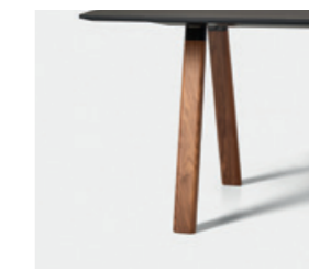
– Solid walnut (natural) Nogal macizo (natural)