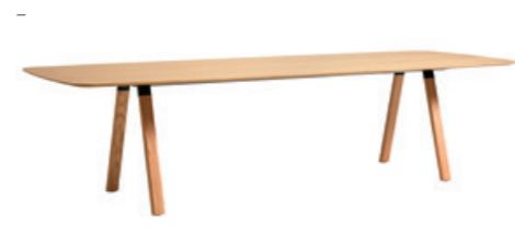
Rectangular-oval tables Mesas ovaladas

1 Section / Sección 120x240cm / 120x320cm