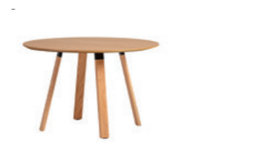
Round tables Mesas redondas

Dimensions / Dimensiones Ø120cm / Ø140cm *Only available in H.75cm *Solo disponible en A.75cm