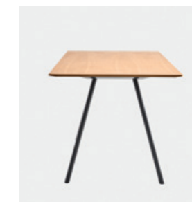
– H.90cm A.90cm