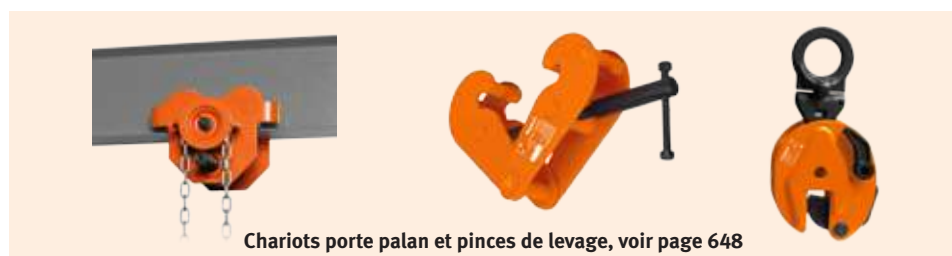
Chariots porte palan et pinces de levage, voir page 648