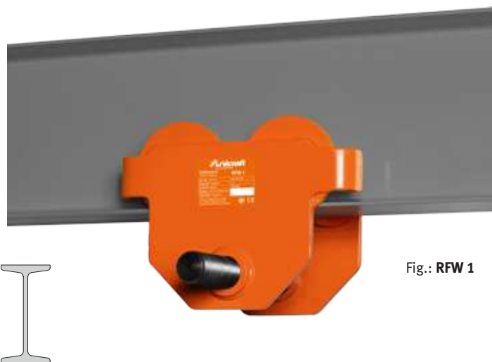
Fig.: RFW 1