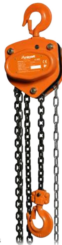
Fig.: K 1001