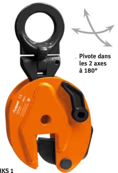
Fig.: HKS 1