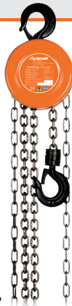
Fig.: K 1000