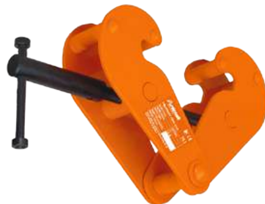
Fig.: TK 1