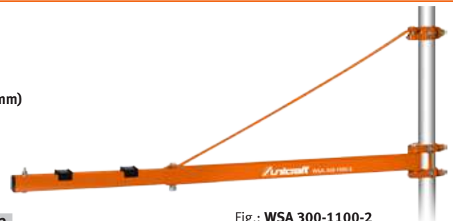
Fig.: WSA 300-1100-2