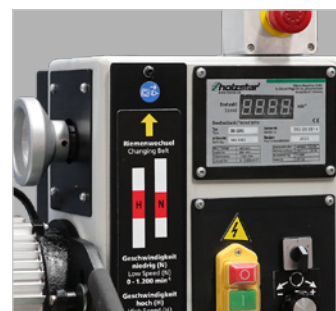
Fig. : DB 1202 Vario