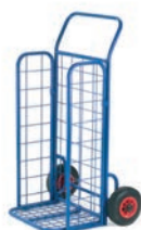
Diabes porte-colis grillage à joues