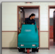
Nettoie près des portes