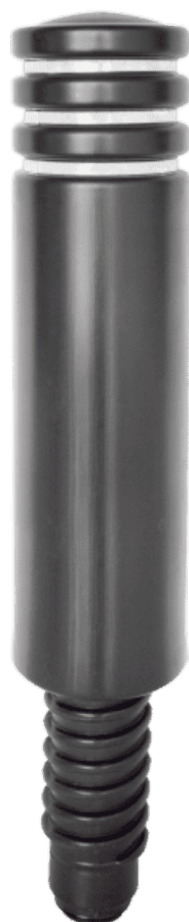
Fourreau encastrable H100B