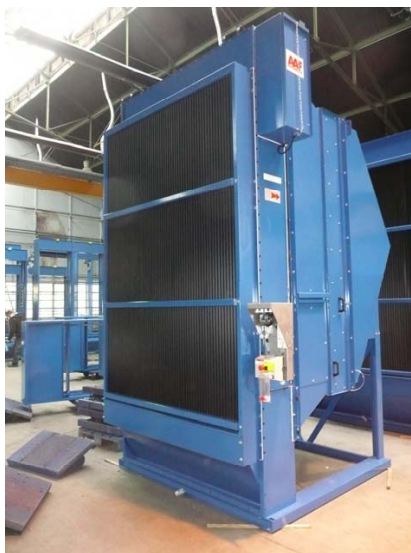
MultiDuty avec plénum