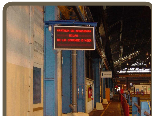
Afficheur industriel EUROPIPE